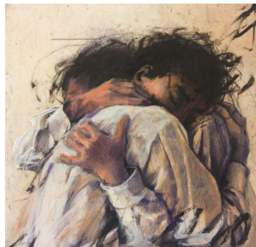
Peter Wever, Umarmung im Quadrat Weiß , 2007, übermalte Farbradiierung, Auflage 150, 41,5 x 41,5 cm auf 53,5 x 53,5 cm