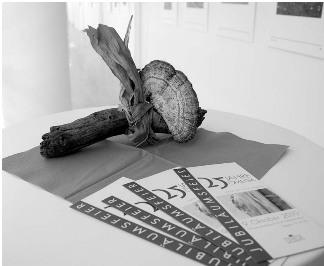
Impressionen vor der großen Feier. Die Vorbereitungen stimmten bis ins kleinste Detail.

Das Programm beginnt um 14.30 Uhr im Wissenschaftspark. Schirmherr ist OB Frank Baranowski, der auch die Gäste begrüßen wird. Danach folgen interessante Gespräche und Vorträge, denen sich um 19.00 Uhr eine Lesung mit Musik anschließt. Nähere Informationen unter www.omega-ev.de oder unter Telefon 91328-22/-21