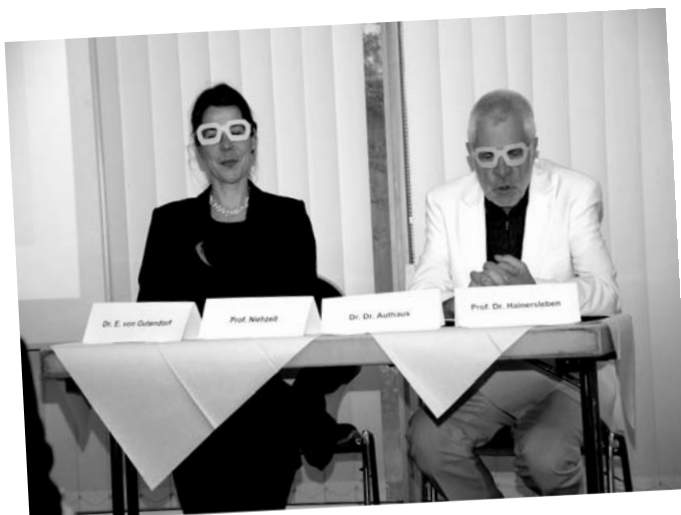
„Es könnte alles so einfach sein - isses aber nicht“, kabarettistische Hospizler im Dialog