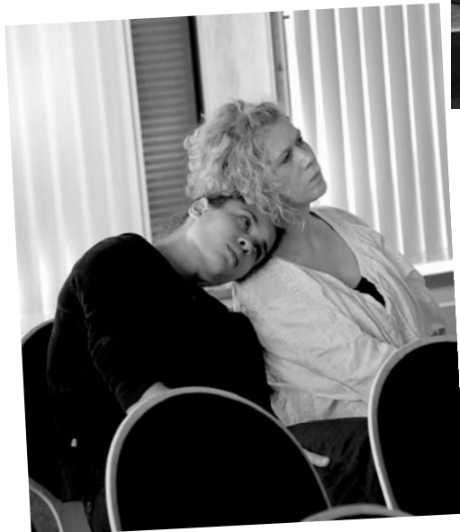
Auch feste feiern macht müde - zwei OMEGAS aus Bielefeld